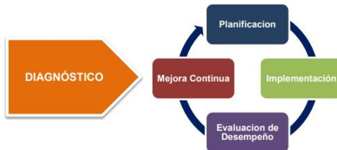
Figura 1 – Ciclo de operación del Modelo de Seguridad y Privacidad de la Información

De acuerdo con la expedición del Decreto 2573 de 2014 contenida en el Decreto Único Reglamentario 1078 de 2015 , comprende cuatro grandes propósitos: lograr que los ciudadanos cuenten con servicios en línea de muy alta calidad, impulsar el empoderamiento y la colaboración de los ciudadanos con el Gobierno, encontrar diferentes formas para que la gestión en las entidades públicas sea óptima gracias al uso estratégico de la tecnología y garantizar la seguridad y la privacidad de la información, por lo cual el modelo de seguridad y privacidad de la información contempla un ciclo de operación que contempla cinco (5) fases que a su vez el modelo puede operar en el ciclo PHVA basado en la ISO 27001, las cuales permiten que las entidades puedan gestionar adecuadamente la seguridad y privacidad de sus activos de información.